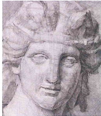
『石膏デッサン(アリアス)』部分 1966 65x50 MBM木炭紙・木炭