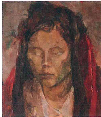
『ショールを被る女』部分 1965 F12号 画布・油絵具