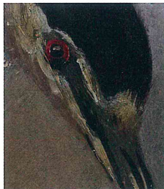
『電熱器と剥製』部分 1976 60x50 削片板・薄綿布・白亜地・卵テンペラ絵具・混合白・油絵具