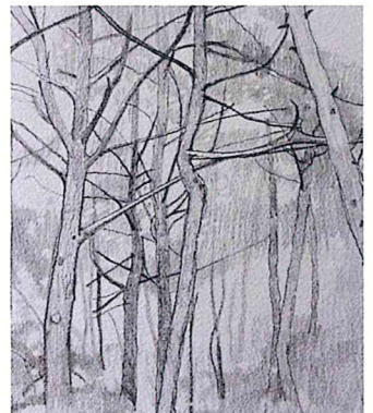
『能登町遠見山郷土館裏の松林』部分 2018 27x38 アルシユ水紙紙・鉛筆