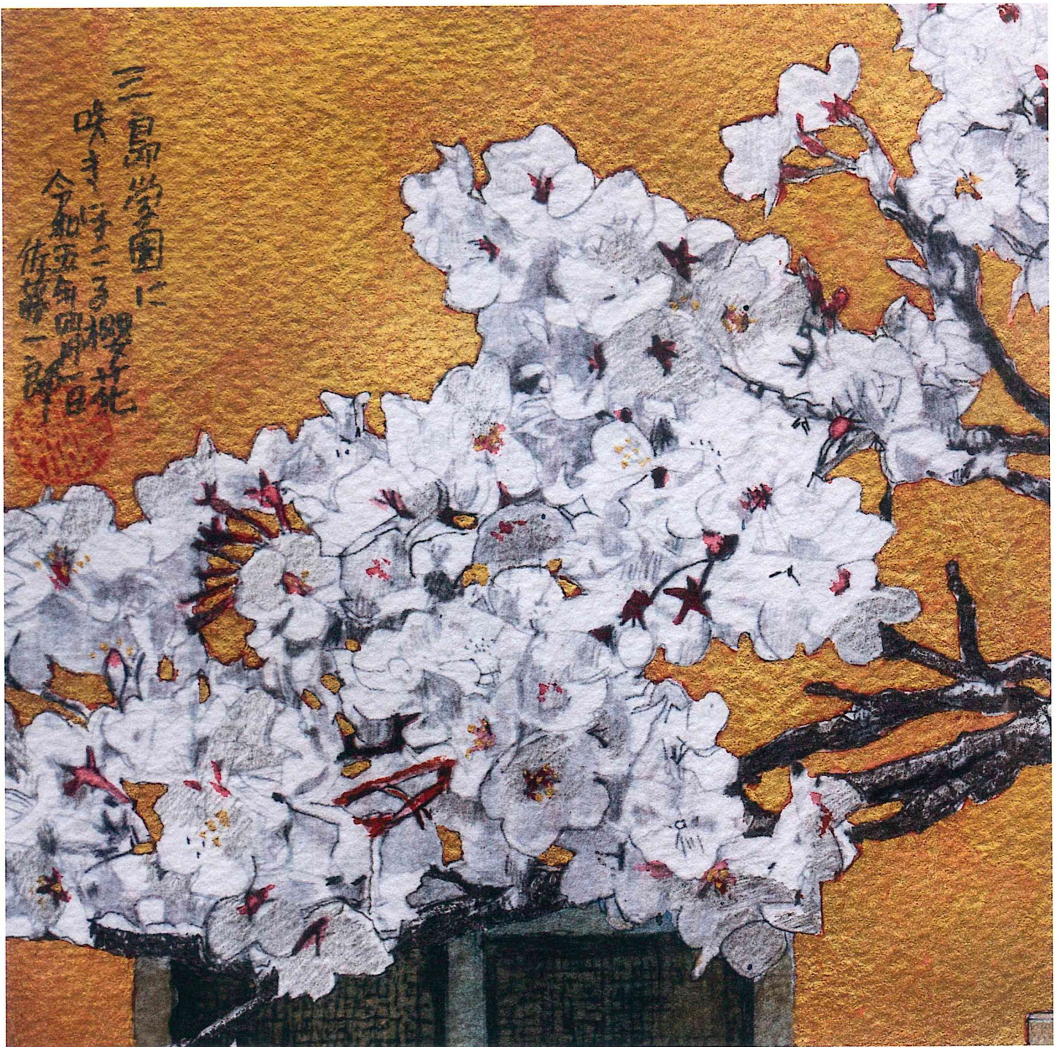
『三島学園に咲きほこる桜花』部分 2023 17x33.5 アルシュ水彩紙、鉛筆、インク、水彩絵具、雲母金泥