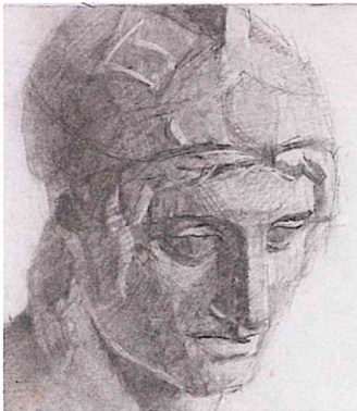
『石膏デッサン(マルス)』部分 1965 65x50 MBM木炭紙・木炭

2004年『明治後期油画基礎資料集成』(中央公論美術出版)。2005年『トンプソン教授のテンペラ画の実技』(三好企画)。2014年『絵画制作入門』(東京藝術大学出版会)。 展覧会:1970年東京藝術大学卒業制作展『透視肖像の圖』(東京藝術大学美術館蔵)、『晶子立像の圖』大橋賞(宮城県美術館蔵)。1973年安井賞候補展『透視群像の圖』(宇都宮美術館蔵)。1981年油絵大賞展『ぬい五歳像』佳作賞(宮城県美術館蔵)。2014年東京藝術大学退任展『蔵王御釜』『那智ノ滝』(宮城県美術館蔵)、『黄山北海』『那智ノ大滝』『二羽の剥製』(東京藝術大学美術館蔵)。