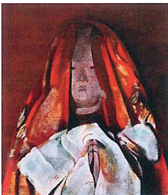
『童子合掌』部分 1971 F30号 画布・油絵具