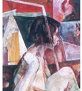
『裸婦坐像1』部分 1967 F30号 画布・油絵具