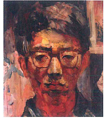
『自画像』1965 F6号 画布・油絵具

東京藝術大学受験期の石膏素描、人物油画から、学部、修士課程在学、西ドイツ留学期、母校教員をへて、現在に至る作品を並べ、その時々わたくしの歩みを振り返ってみたい。